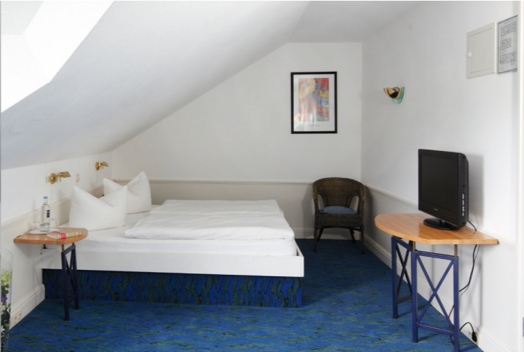
◀ Klassik Schlaf-/ Wohnbereich ▶