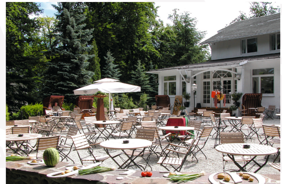
▲ Terasse des Restaurants