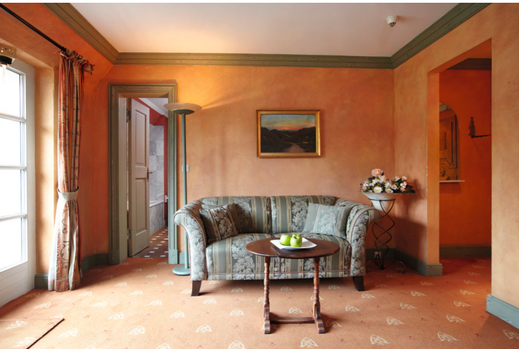
Doppelbettzimmer Komfort ▲