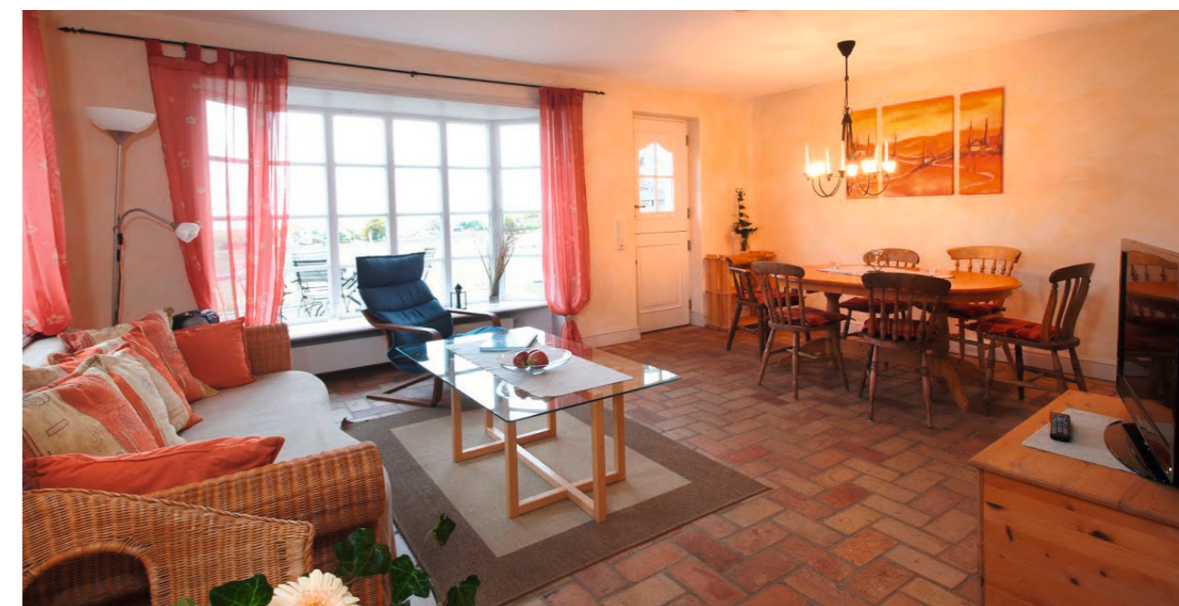
▲ Erdgeschoss Wohnbereich