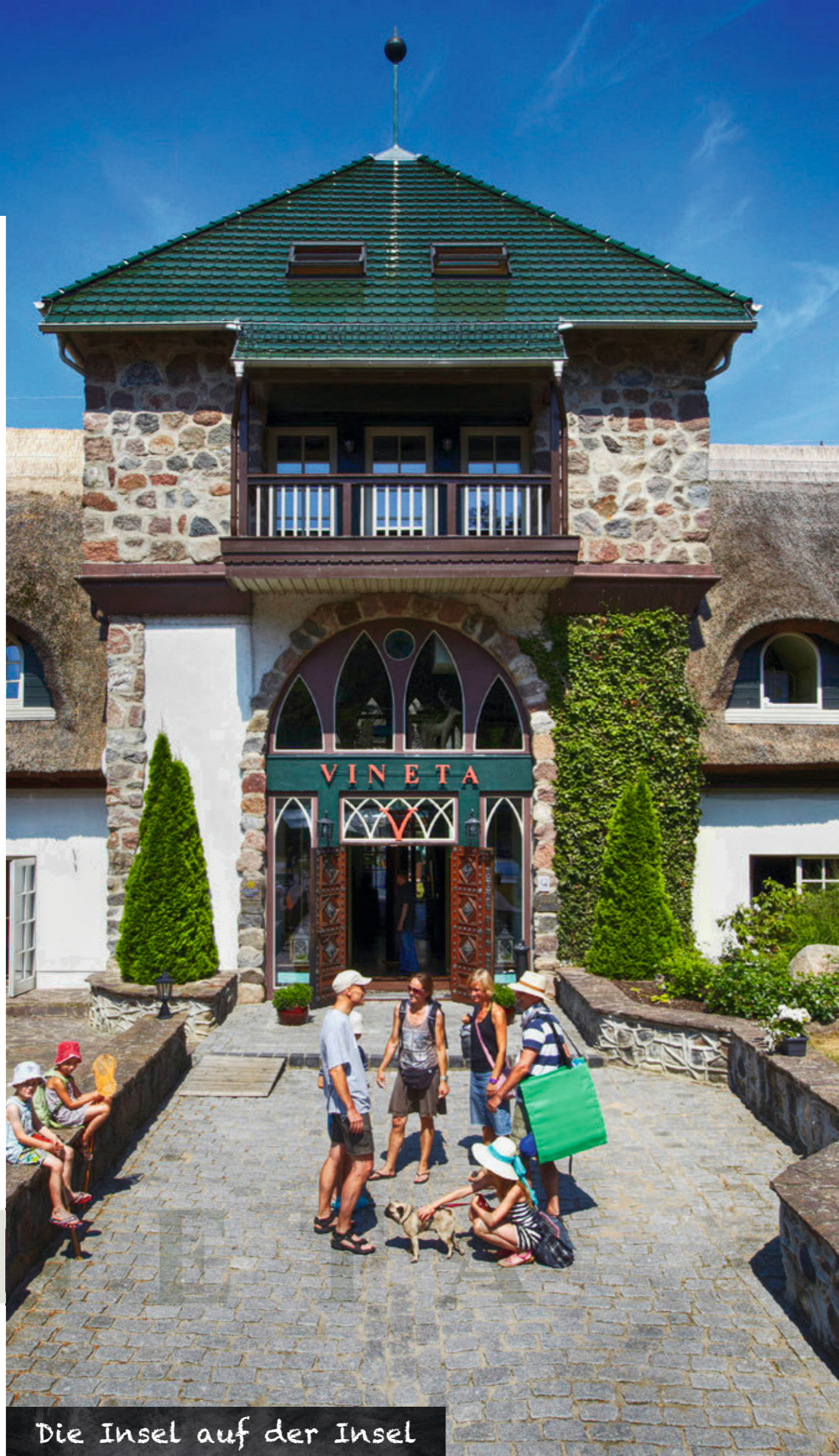
Die Insel auf der Insel

Unsere 68 Hotelzimmer in verschiedenen Kategorien verfügen über ein individuelles Ambiente. Sie erhalten durch ihren Stil einen ganz besonderen und unverwechselbaren Charme und sind mit viel Liebe zum Detail eingerichtet. Die Hotelzimmer verfügen teilweise über einen Balkon bzw. eine Terrasse.