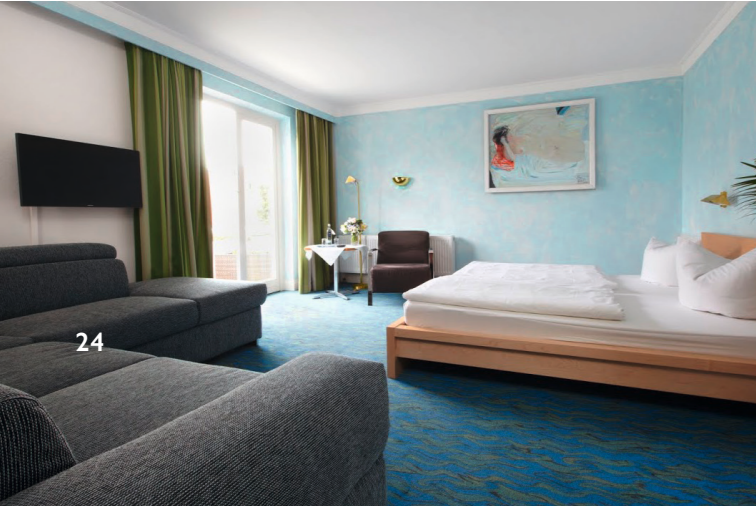
◀ Schlaf-/ Wohnbereich