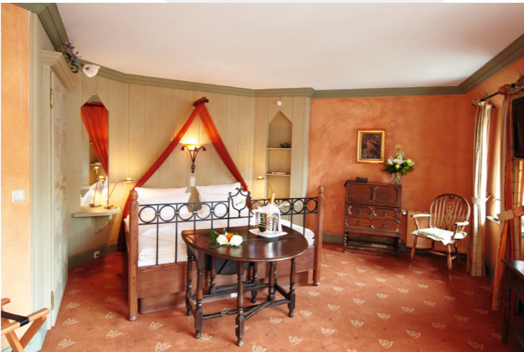
▲ Doppelbettzimmer Komfort