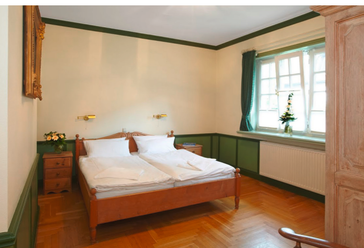
◀ Schlafzimmer Erdgeschoss

Unsere vier exklusiven Ferienwohnungen unter Reetdach befinden sich auf dem Gelände des Hotels «Forsthaus Damerow».