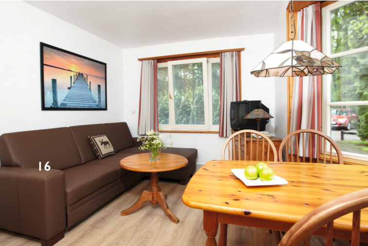
◀ Wohnzimmer ▶ Schlafzimmer ▶

Unsere Bungalows sind zweckmäßig eingerichtet und befinden sich in der Ferienanlage am Hotel «Forsthaus Damerow», unweit gelegen sowohl vom Ostseestrand als auch vom Achterwasser mit dem hauseigenen Bootsanleger. Gäste der Bungalows können das gesamte Angebot des Hotels in Anspruch nehmen.