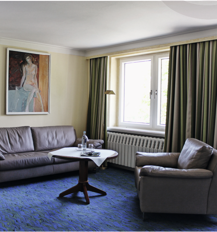
Doppelzimmer Komfort Wohnbereich ▶