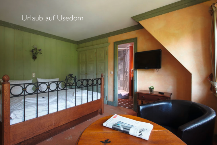
Doppelbettzimmer Klassik ▲