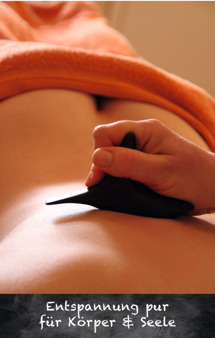
Entspannung pur für Körper & Seele