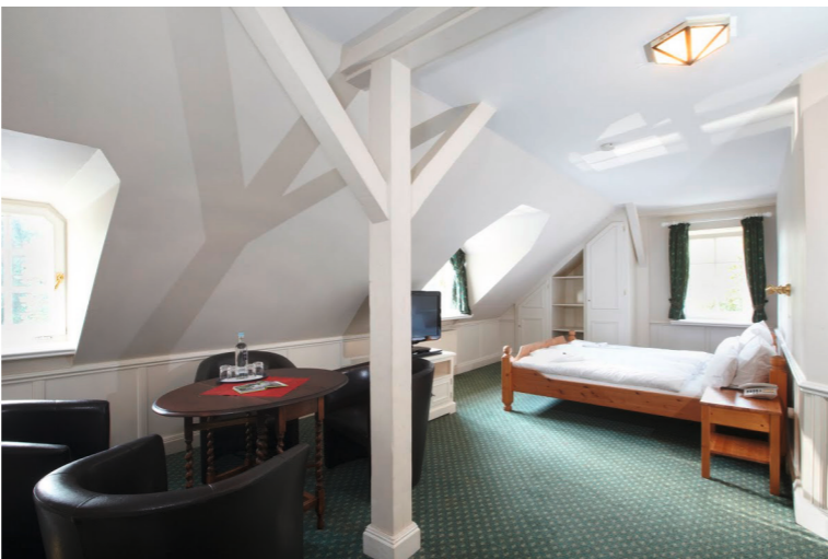
Vier Personen Appartement ▼