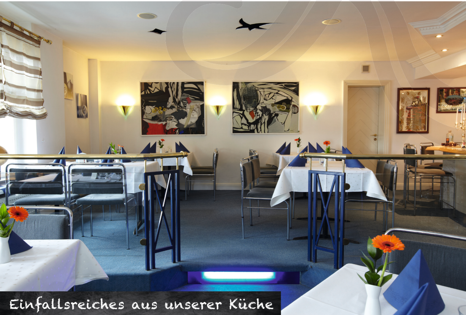
Einfallsreiches aus unserer Küche

Kulinarische Highlights erwarten Sie in unserem à la carte und Halbpensions-Restaurant “Marron d’Or”. Genießen Sie die „Regionale Frische Küche“, erlesene Weine und hausgemachte Kuchen und Waffeln. Unsere Restaurantterrasse lädt im Sommer zum Barbecue ein mit Köstlichkeiten vom Grill und Musik für jeden Geschmack. Den Abend lassen Sie bei einem Glas Rotwein in unserer gemütlichen Kaminbar ausklingen.